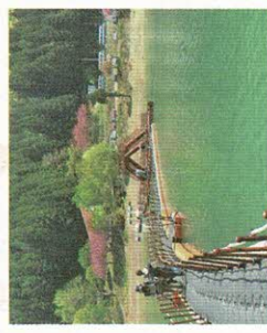
村上市岩前 ☎090-3478-5090 (衛星電話)

三面ダム湖に浮かぶ2つの島を整備した湖に面したキャンプ場です。白鳥のサイトや木製のアスレチックなどがあり、親子でアウトドアが楽しめます。ダム湖に浮かぶ島にかかる浮き桟橋を渡る時のワクワク感、子どもも大人も冒険心がくすぐられます。山々に囲まれた大自然の中で、ご家族そろってゆったりした時間を過ごしてください。