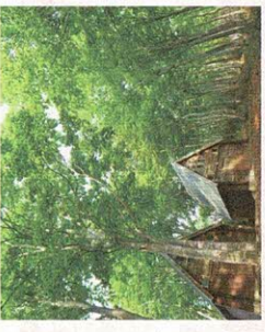
上越市板倉区関田4046-6 ☎0255-78-2141 (板倉区総合事務所)

長野県との県境、黒倉山麓に広がる光ヶ原高原は、標高800メートル～1,100メートルに位置し、頸城平野を眼下に望むロケーションは格別です。澄み切った空気とさわやかな風の中で、開放感あふれるひとときを、ご家族で過ごしてみませんか。