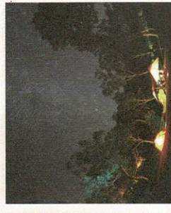
妙高市杉野沢笹ヶ峰 ☎0255-82-3168 (休暇村妙高関山本館)

標高1,300mに位置する笹ヶ峰キャンプ場はアウトドアを満喫するには最高の場所。周辺には牧場や遊歩道があり、自然を満喫できます。また夜には満天の星空が皆様をお迎えいたします。焚き火を楽しみながらの星空観察はおすすめ。笹ヶ峰キャンプ場でのアウトドアライフは家族の特別な時間になることでしょう。